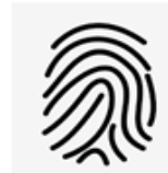
Verificación en Base De Datos