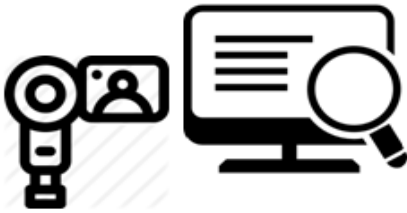
Capturación Documentación Identidad y Biométricos