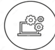
Reglas de Operación